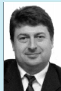
Илиян Цонев, кмет на община Бяла